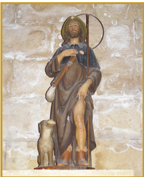
San Roque - Patrón de Enguídanos

A tan solo 30 y 40 kilómetros de Motilla del Palancar y Alarcón respectivamente, se encuentra la localidad de Enguídanos, un verdadero refugio natural que ofrece los paisajes naturales más insólitos de la región . Un lugar perfecto para la práctica del turismo activo de naturaleza o, simplemente, para contemplar los impresionantes paisajes de las hoces del Cabriel en uno de los espacios naturales más imponentes y mejor preservados de España. Enguídanos dispone, además, de un interesante patrimonio cultural y arqueológico ( http://enguidanos.es/ ).